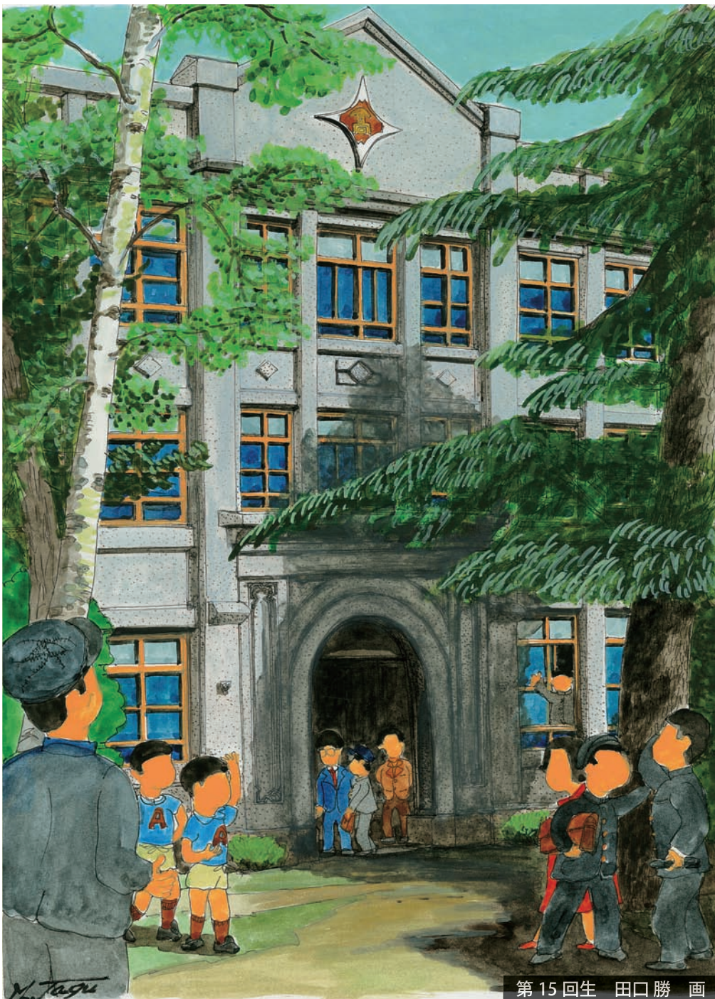
第15回生 田口勝 画