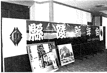
3 F グランデ前ロビー