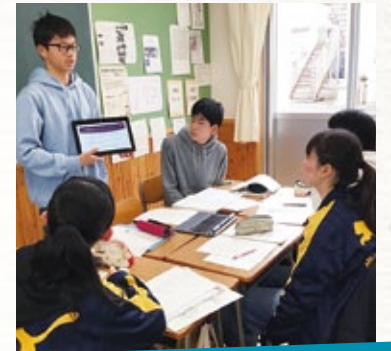
世界で活躍できるリーダーを目指して

探究学習を進めていく上で、ICT環境の整備や外部との連携が欠かせません。それに当たり、同窓会よりふるさと納税によるWiFi環境の整備や進路講座の講師派遣など、多大なる援助やご協力をいただきました。本年2月には研究発表会を行う予定です。是非多くの同窓生の方にもお越しいただき、生徒の学習成果をご覧いただければと思います。 今後も引き続きご支援よろしくお願いいたします。