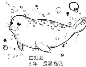
白虹会 3年 長瀬桜乃